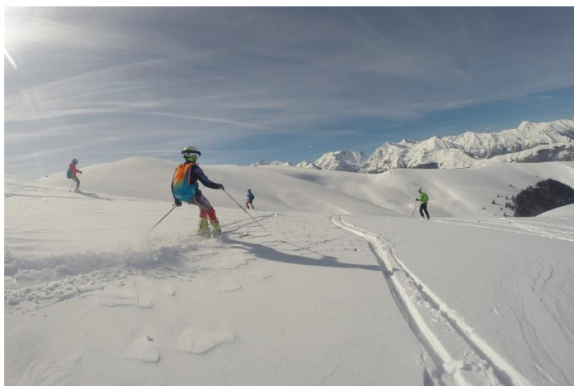
Les jeunes lors d'une sortie montagne sur les hauteurs du Louron