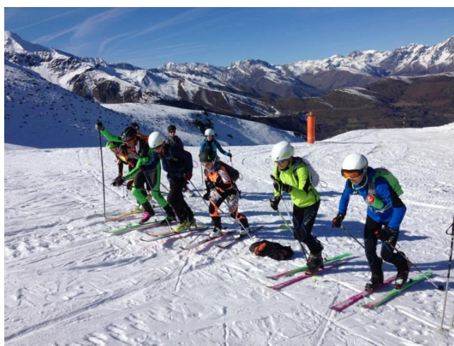
Entrainements spécifiques aux techniques du ski alpinisme : conversion, manipulations, glisse...