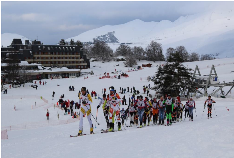
Départ de la première Vertica Louron – 21 Février 2018

Nous utilisons aussi le site internet ( www.transpyros.fr ) et la page Facebook pour encore mettre en avant votre aide précieuse pour cette école de ski alpinisme.