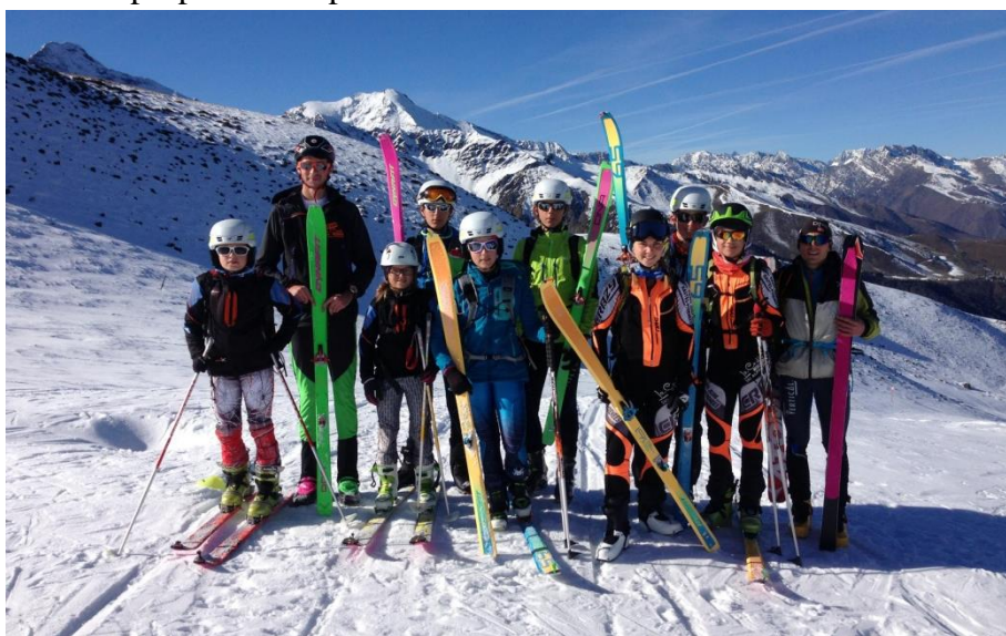
Le groupe des jeunes presque complet lors du premier entraînement sur les skis en 2017

Cette section est ouverte aux catégories Minimes-Cadets-Juniors (catégorie FFME : de 1999 à 2007). Une formule est proposée comprenant la licence FFME et les assurances.