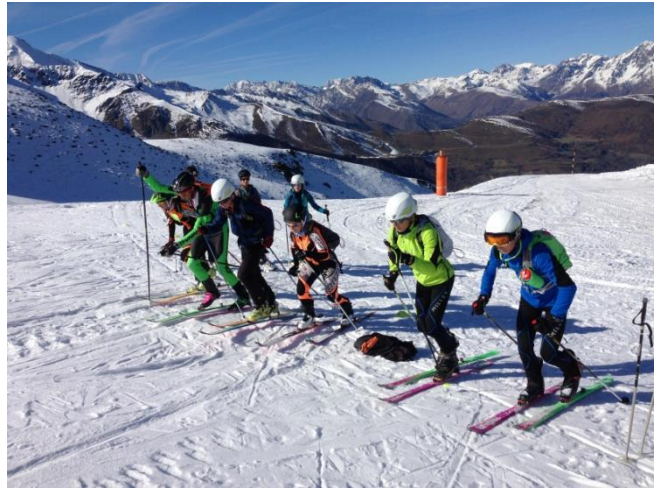
Entraînements spécifiques aux techniques du ski alpinisme : conversion, manipulations, glisse...