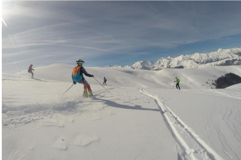
Les jeunes lors d'une sortie montagne sur les hauteurs du Louron